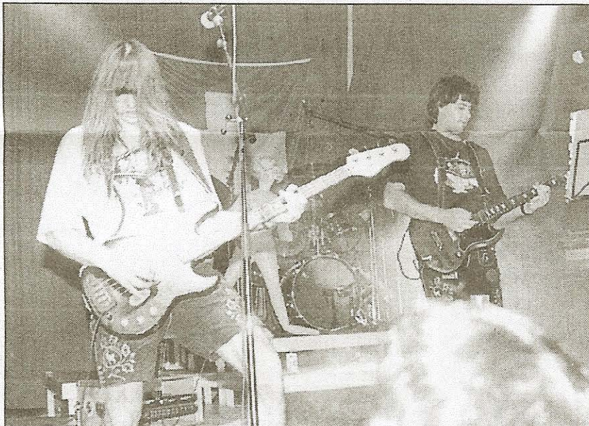
Die «tyte stone» in voller Fahrt....